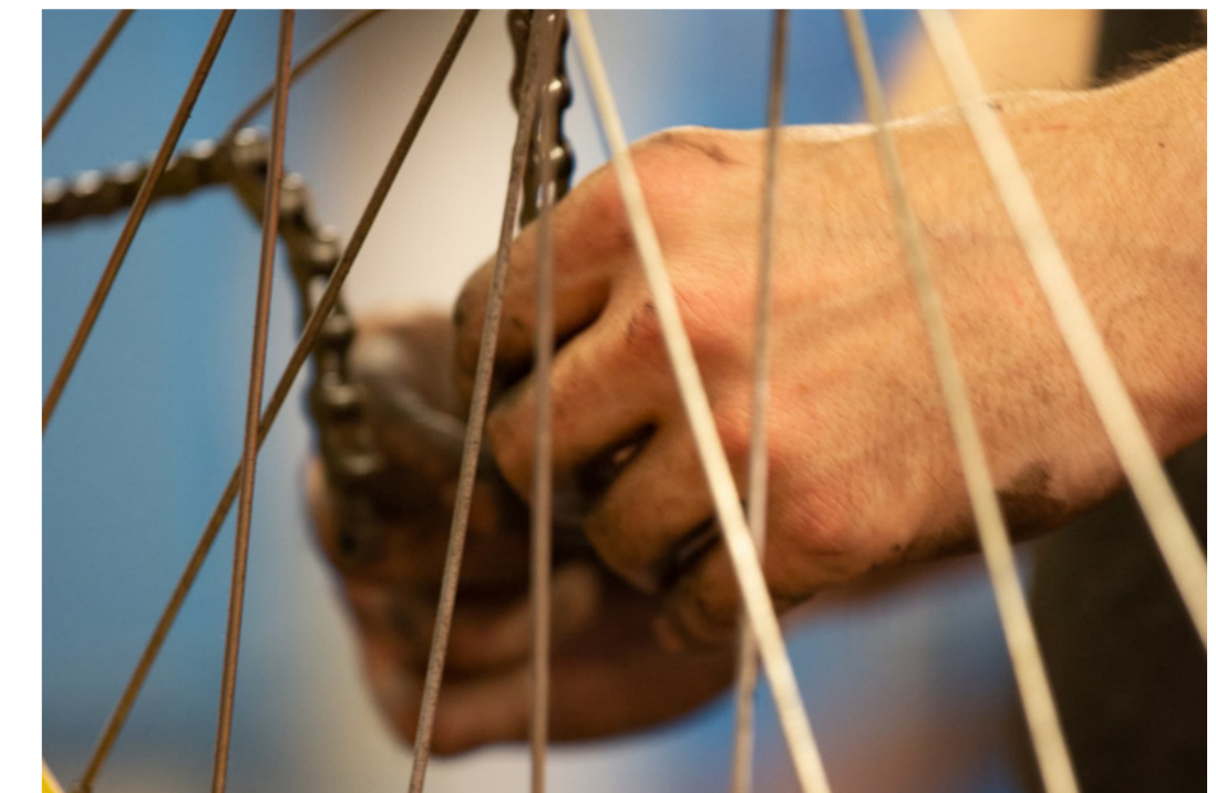
VUL De Fietsambassade Gent vzw, Botermarkt 1, 9000 Gent.

Info & opening hours: www.fietsambassade.gent.be/en